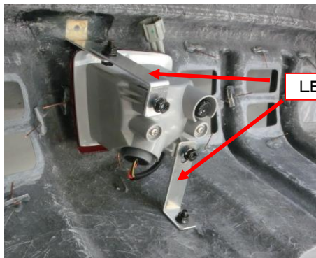
LEDバックフォグランプ固定ブラケット