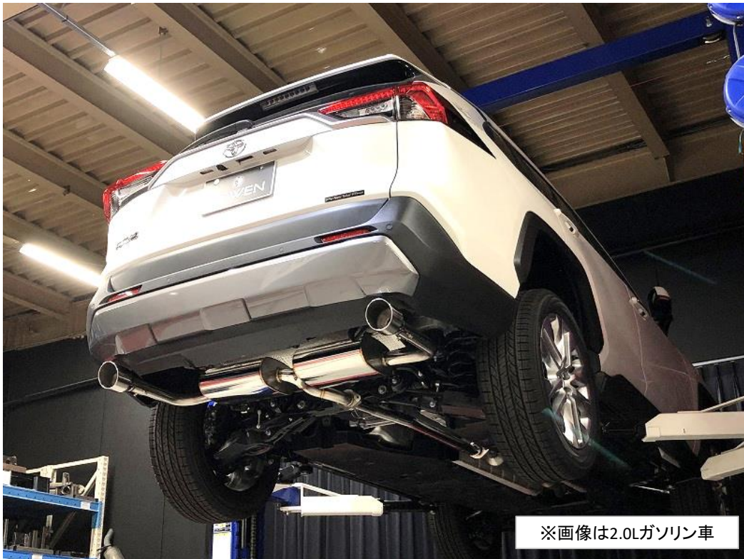
※画像は2.0Lガソリン車

製造/販売元 株式会社 E・Rコーポレーション ROWEN事業部 愛知県豊田市堤本町山畑7 TEL:0565-52-8555